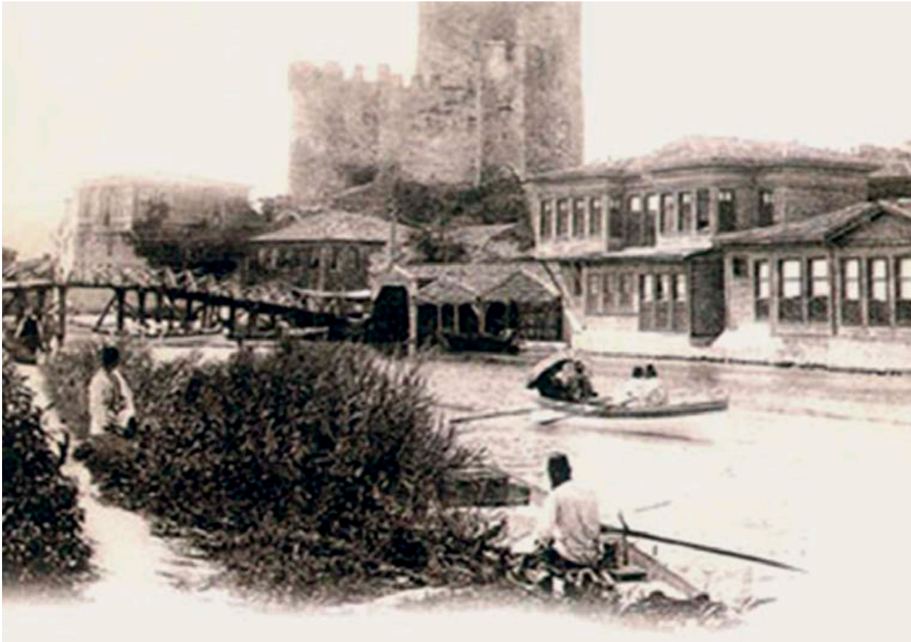
(3) Göksu Mesiresi; http://www.ahisar.com/dagarcik/anadoluhisari-en-eski-turk-mahallesi.html

Arıtan, Ö., 2008, "Modernleşme ve Cumhuriyetin Kamusal Mekân Modelleri", Mimarlık Dergisi , Sayı: 342