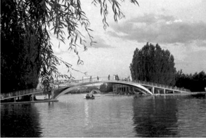
(5) Ankara Gençlik Parkı; http://img.eba.gov.tr/580/04a/127/ef8/7b0/df4/2e0/8bd/8d2/761/e96/82c/25c/e5a/146/58004a127ef87b0df42e08bd8d2761e9682c25ce5a146_570.jpg