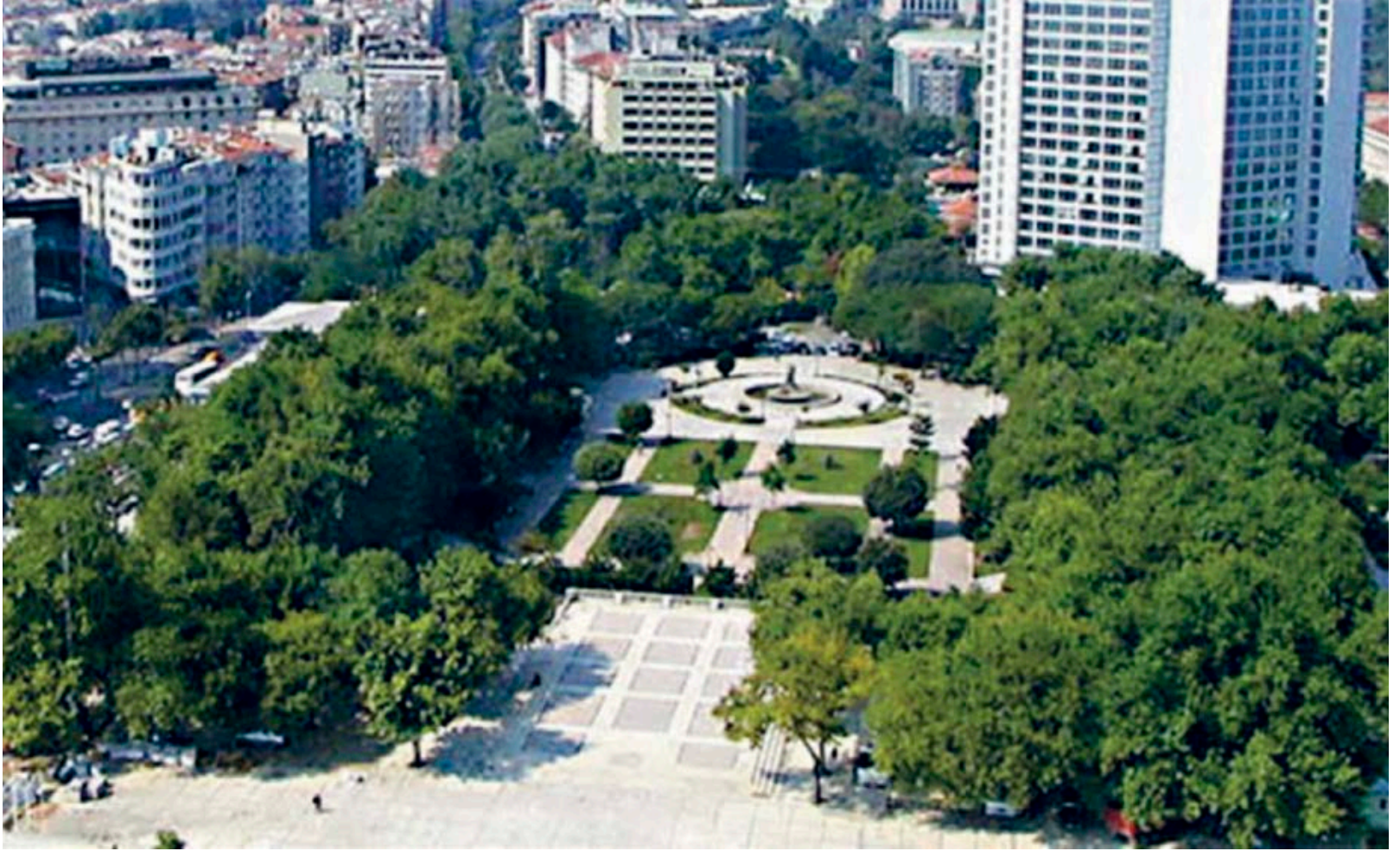
(9) Taksim Meydanı Gezi Parkı; http://www.ufuktarhan.com/makale/gezi-gazi-ve-siyaset-geziparki-occupygezi-direngeziparki