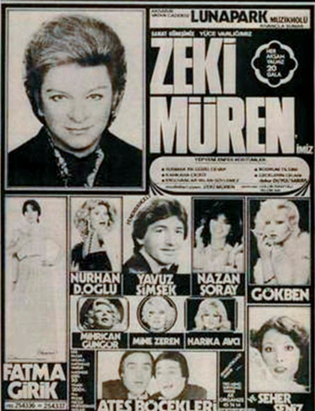
(7) İzmir Fuarı, 1970'ler; http://blog.adresgezgini.com/izmir-enternasyonal-fuari%e2%80%99nin-bilinmeyen-hikayesi-2/izmir-fuari-2-2/