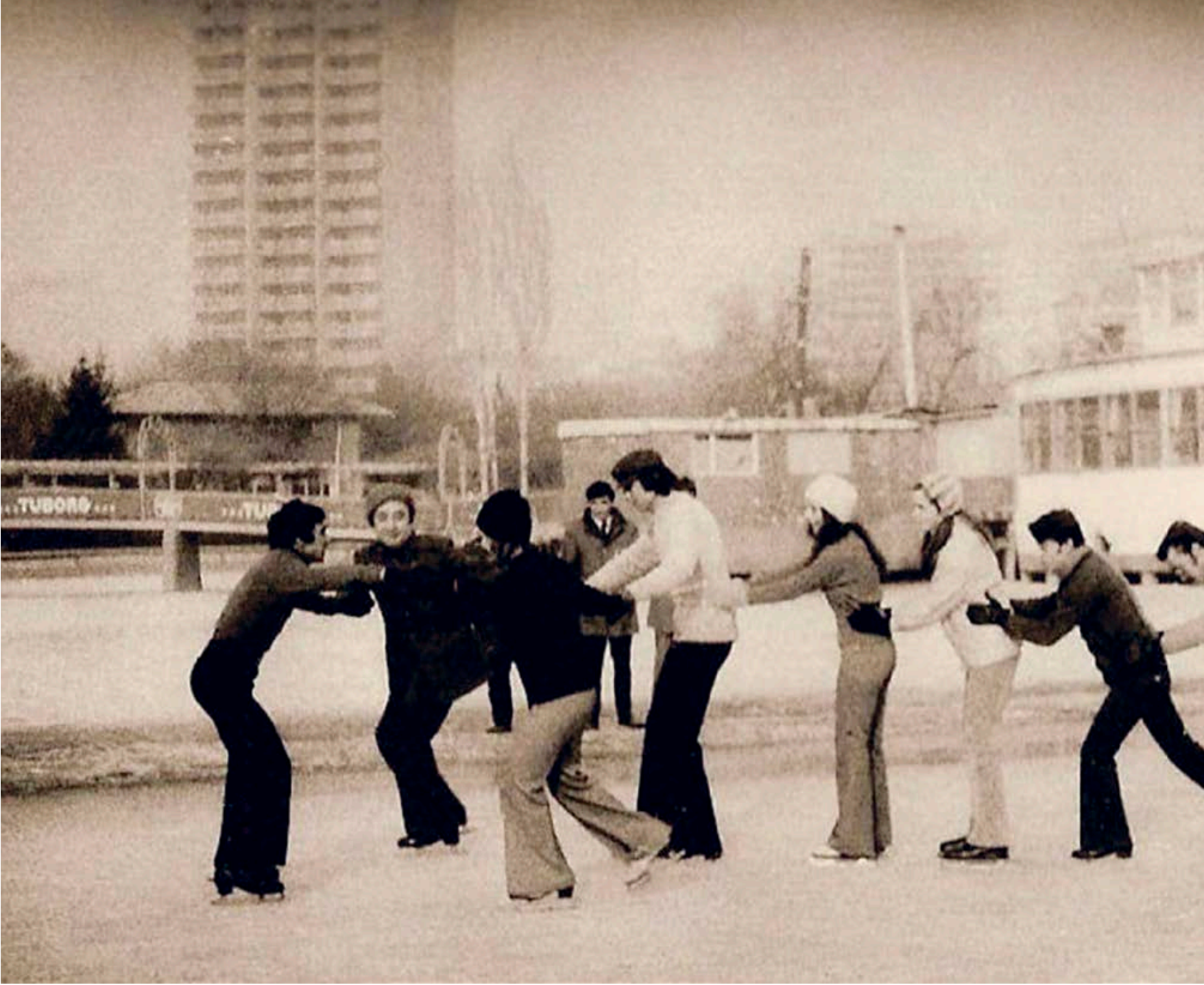
(4) Ankara Gençlik Parkı; http://e-bulten.library.atilim.edu.tr/sayilar/2009-06/ankara.html

büyüğünde gazino-lokanta küçüğünde ise iskele-kayıkhanenin tasarlandığı iki ada yer alır. Adaları karaya bağlayan köprüler, çocuk oyun alanları, gezinme, dinlenme bölgeleri, büfeler, kuş bahçesi, kahve, Açık hava tiyatrosu ve sonradan eklenen lunapark Gençlik Parkı'ndaki önemli kullanımlardandır. 14