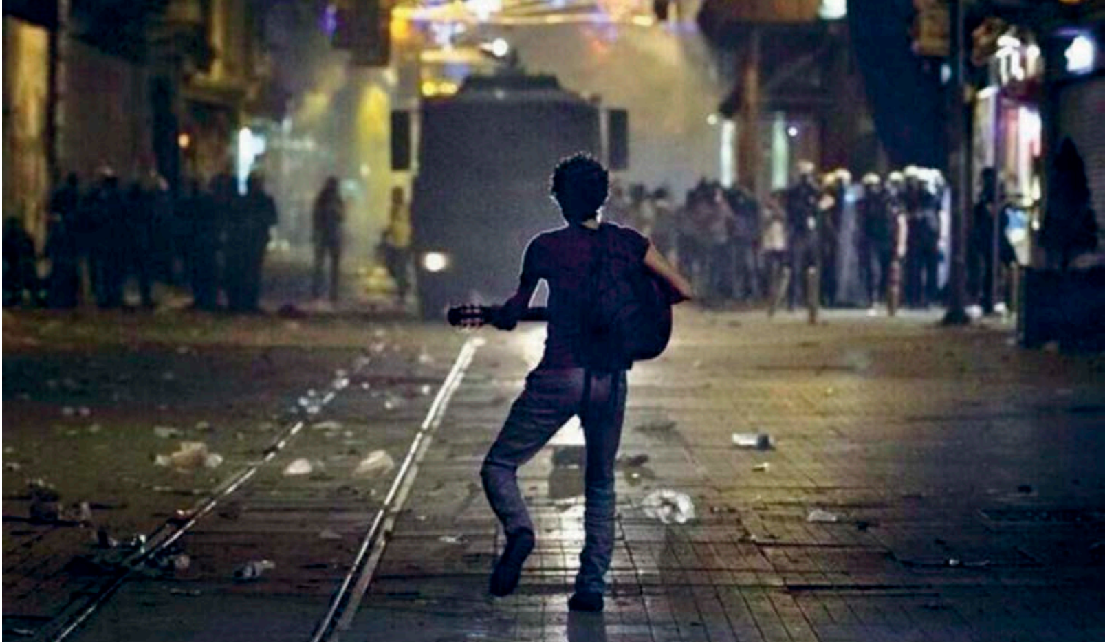
(10) Gezi Olayları sırasında tepkisini sanatını icra ederek gösteren genç, Taksim; http://www.haberself.com/h/1471/