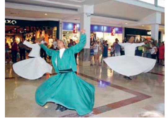
(8) Çeşitli AVM'lerde düzenlenen kültürel etkinlikler; http://www.okyanuskoleji.k12.tr/haber/okyanus-un-avm-etkinlikleri-ramazan-ayina-renk-katti-3372

21 Kuruyazıcı, H., 1998, Cumhuriyet'in İstanbul'daki Simgesi: Taksim Cumhuriyet Meydanı, 75 Yılda Değişen Kent ve Mimarlık , İstanbul, Türkiye İş Bankası Kültür Yayınları ve Tarih Vakfı Ortak Yayını