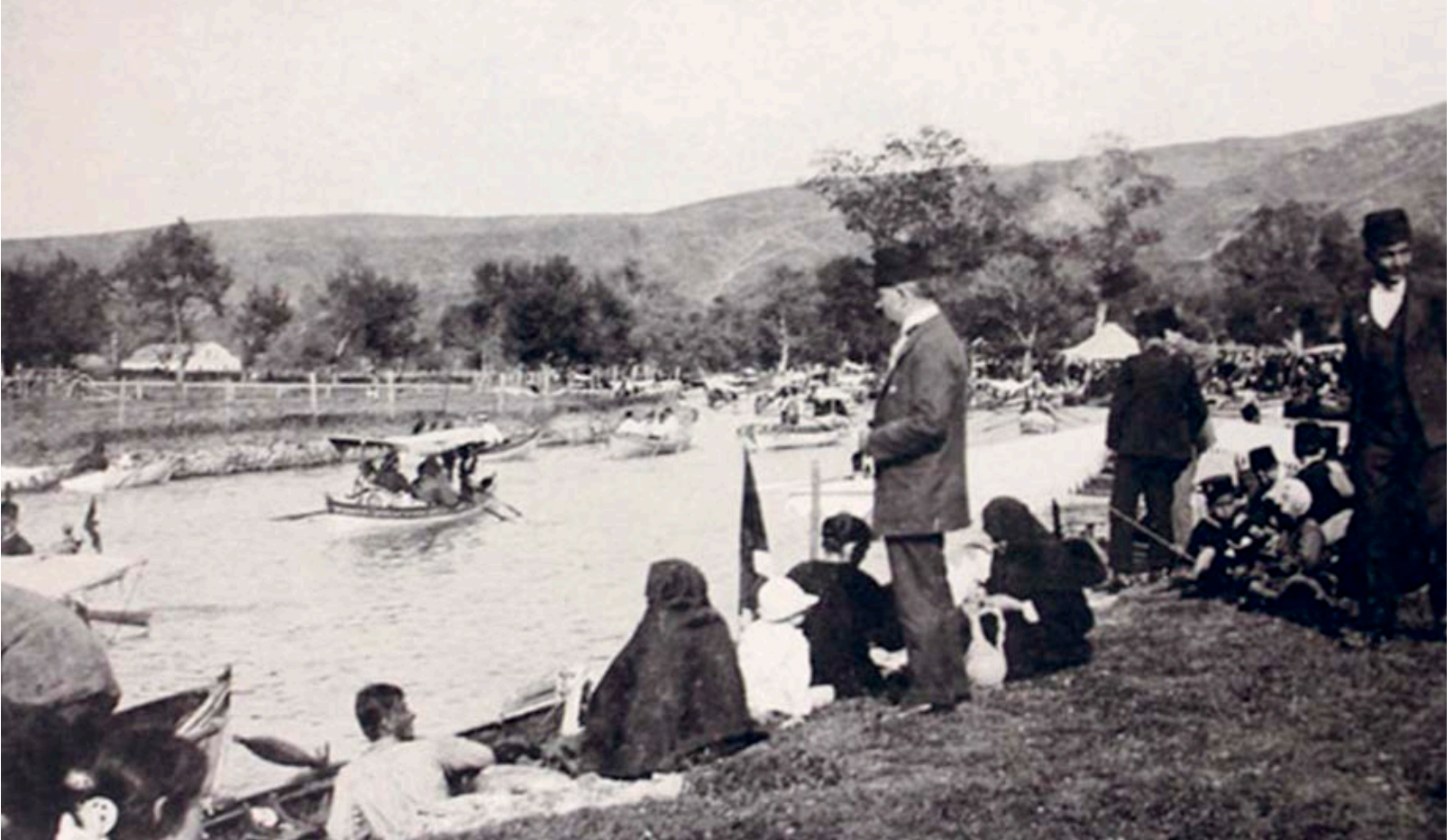
(2) Kağıthane Mesiresi